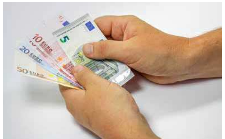
Wenn Liquiditätsengpässe drohen, kann es nötig werden, nach den neuen IDW-S-6-Standards den Geldgebern ein Sanierungsgutachten vorzulegen.