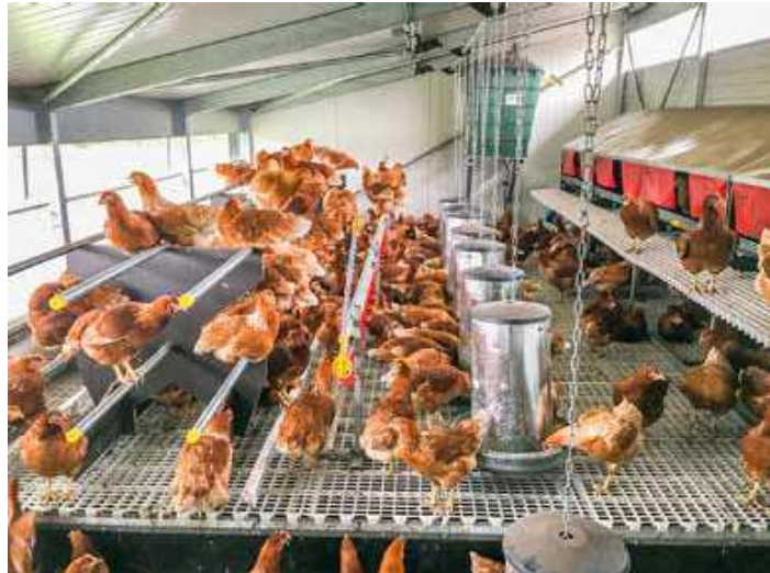
Mobile Hühnerhaltung im Würdekemper Mobilstall mit Stalltechnik der Kari Farming GmbH

Die Firma Kari Farming aus Herzebrock-Clarholz hat ihren Ausstellungsstand neu gestaltet. Über den Direkt- und Onlinevertrieb bietet Kari ein breites Angebot von Stall- einrichtungen und Tierhaltungsbe-